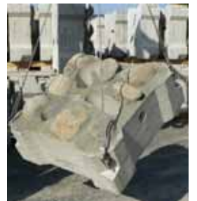
ナチュストーン：材料表 10m2 当たり