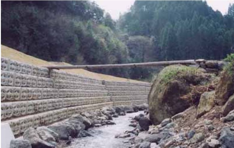
河川施工直後 半年後